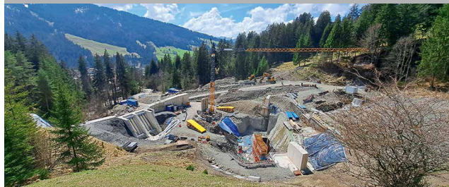
Hochwasserschutz, Oberallgäu – Planen im alpinen Einflussgebiet